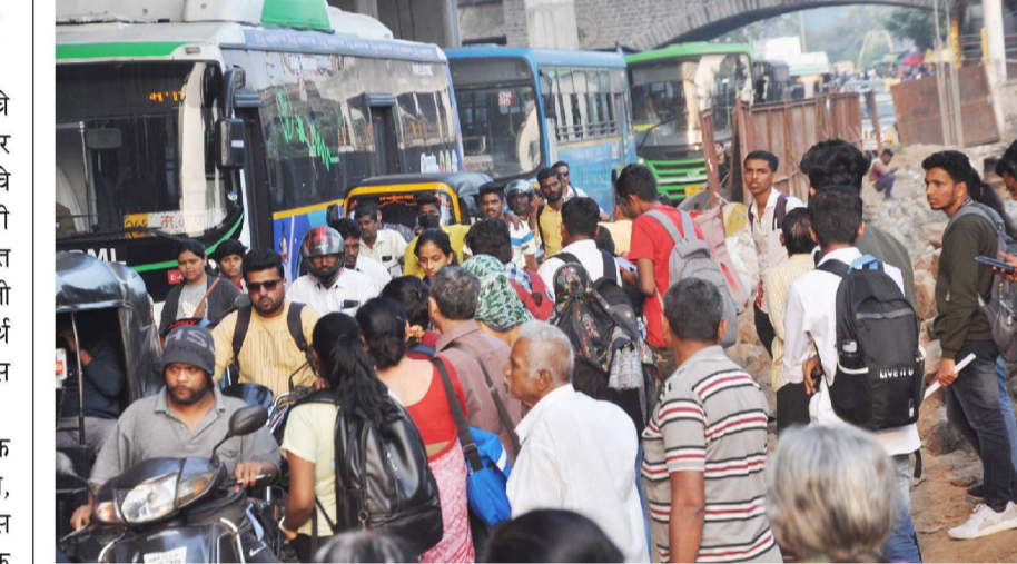
■ पीएमपीएलच्या मनपा बसस्थानकात बसगाड्यांच्या गर्दीमुळे प्रवासी आणि नागरिकांची रस्ता ओलांडताना अडचणींचा सामना करावा लागत आहे. ज्येष्ठ नागरिकांना याचा अधिक त्रास होत आहे.

■ औषधाचा वापर करून दूधवाढीचा प्रयत्न मानवी आरोग्यास अपायकारक आहे. त्यामुळे ऐकू कमी येणे, दृष्टीहीनता, पोटाचे आजार, नवजात बाळींना काळीज, गरोदर स्थितींना अनैसर्गिक गर्भपात, त्वचाविकार होण्याची राशक्या आहेत.